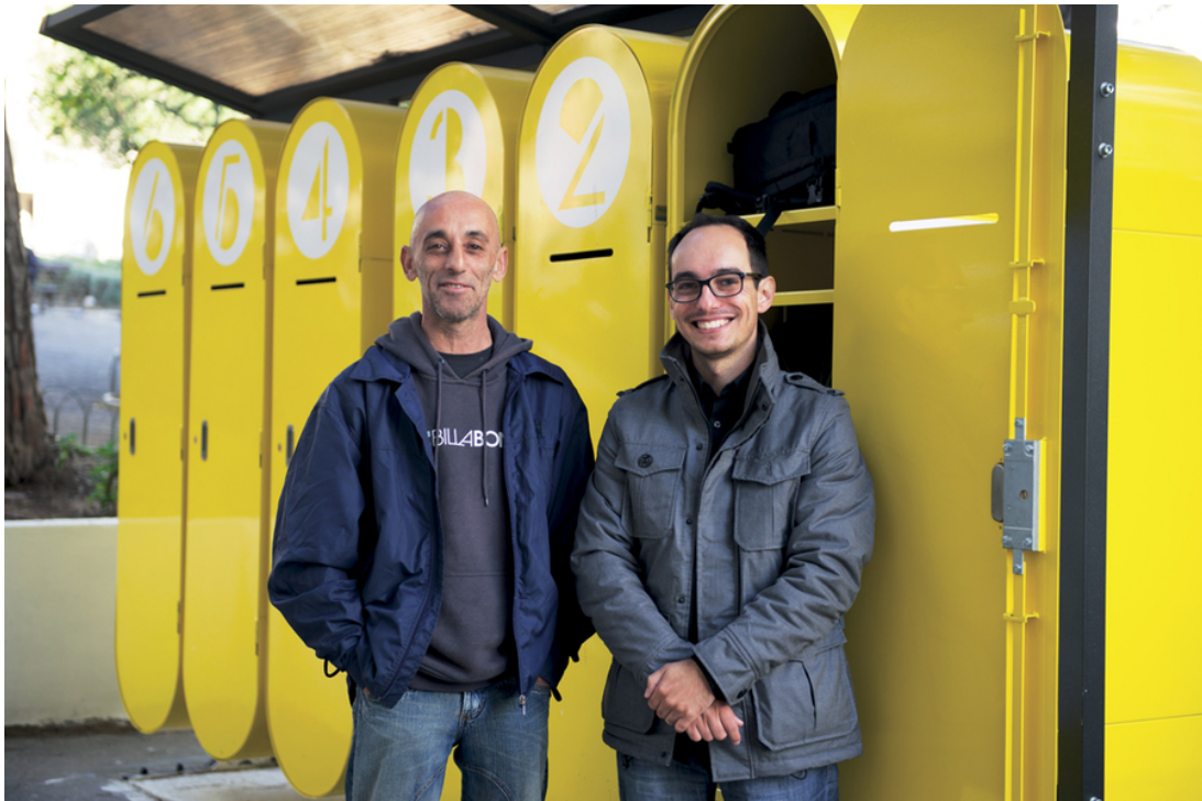
Lidé v nouzi si mohou v Lisabonu bezpečně uskladnit nejdůležitější osobní věci.