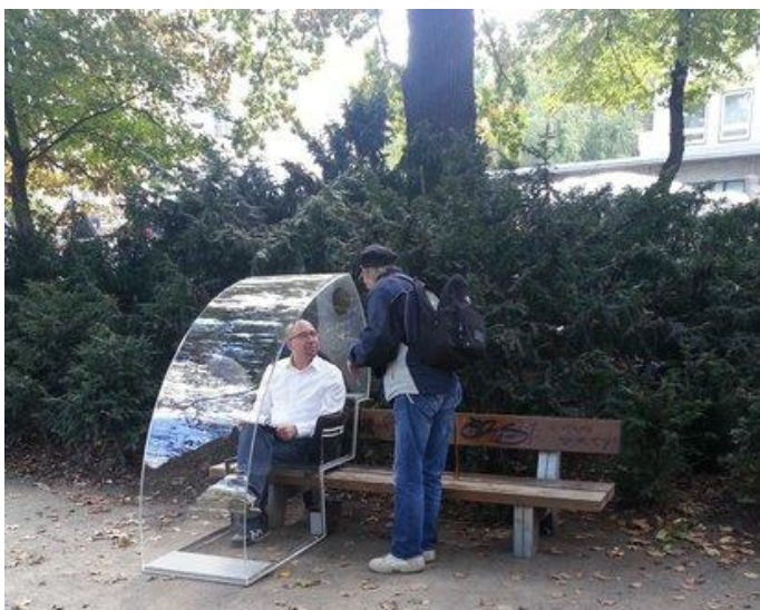
Přístřešek Monozelle v Berlíně.

Umělecký zásah v Berlíně „Monozelle“ upozorňující na nedostatek přístřešků proti dešti byl instalován v roce 2017 a vyvolal mnoho diskusí.