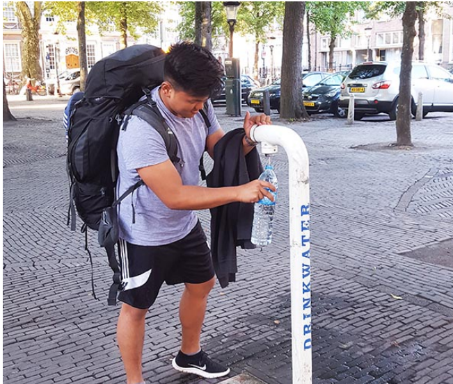
Pitná voda v centru města, Amsterdam.