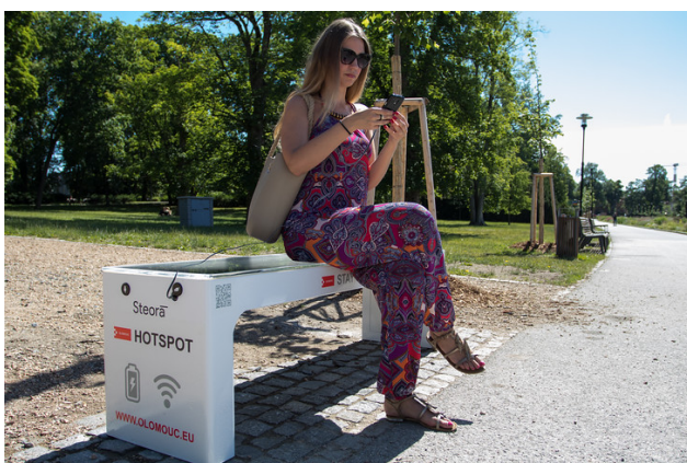
Veřejné lavičky v Olomouci zajišťují možnost připojení i dobítí telefonu.

Vhodně by mohla být využita například solární energie – v mnoha evropských městech, jsou na autobusových zastávkách či lavičkách k dispozici elektrické zásuvky nebo nabíječky na solární energii. První takové lavičky navíc i s wi-fi připojením zavedla v ČR Olomouc. Praha „chytré“ lavičky pilotně zavedla, nicméně projekt vyhodnotila jako neúspěšný. Doporučujeme zvážit revizi projektu a jeho obnovení v udržitelnější formě.